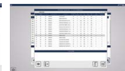
gestione acquisti e magazzino purchasing & warehouse management