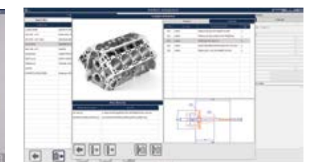
gestione scheda utensile tool job/kit management