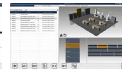
configurazione tool room tool room layout