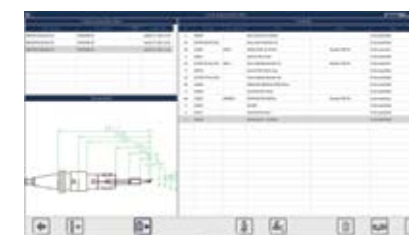
lista di preparazione utensili tool preparation list