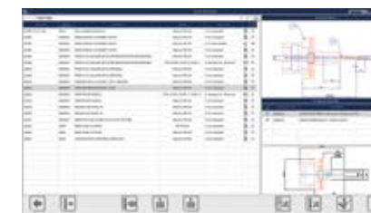
assemblaggio/disassemblaggio utensili tool assembly / disassembly

«The on-time delivery every day of the right tool to the right machine when running 5,000-6,000 different cutting-tool assemblies on scores of machine tools on five automotive-engine-machining lines is quite an achievement. These are the contributions of a computerized tool-presetting and -management system to the smooth running of Fiat's Termoli 3 engine plant.»