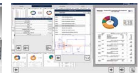
report e business intelligence reporting & business Intelligence